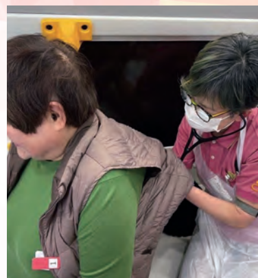
医療 MaaS での活躍